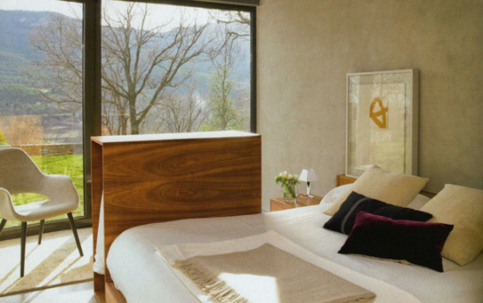
DORMITORIO PRINCIPAL. Mobiliario diseñado por Ramón Roselló. Sábanas, modelo Pur, de Nobel, adquiridas en Arkitektura, al igual que la alfombra, de Ruckstuhl. Manta color camel, en Azul Tierra. Cojines, de CoriumCasa.