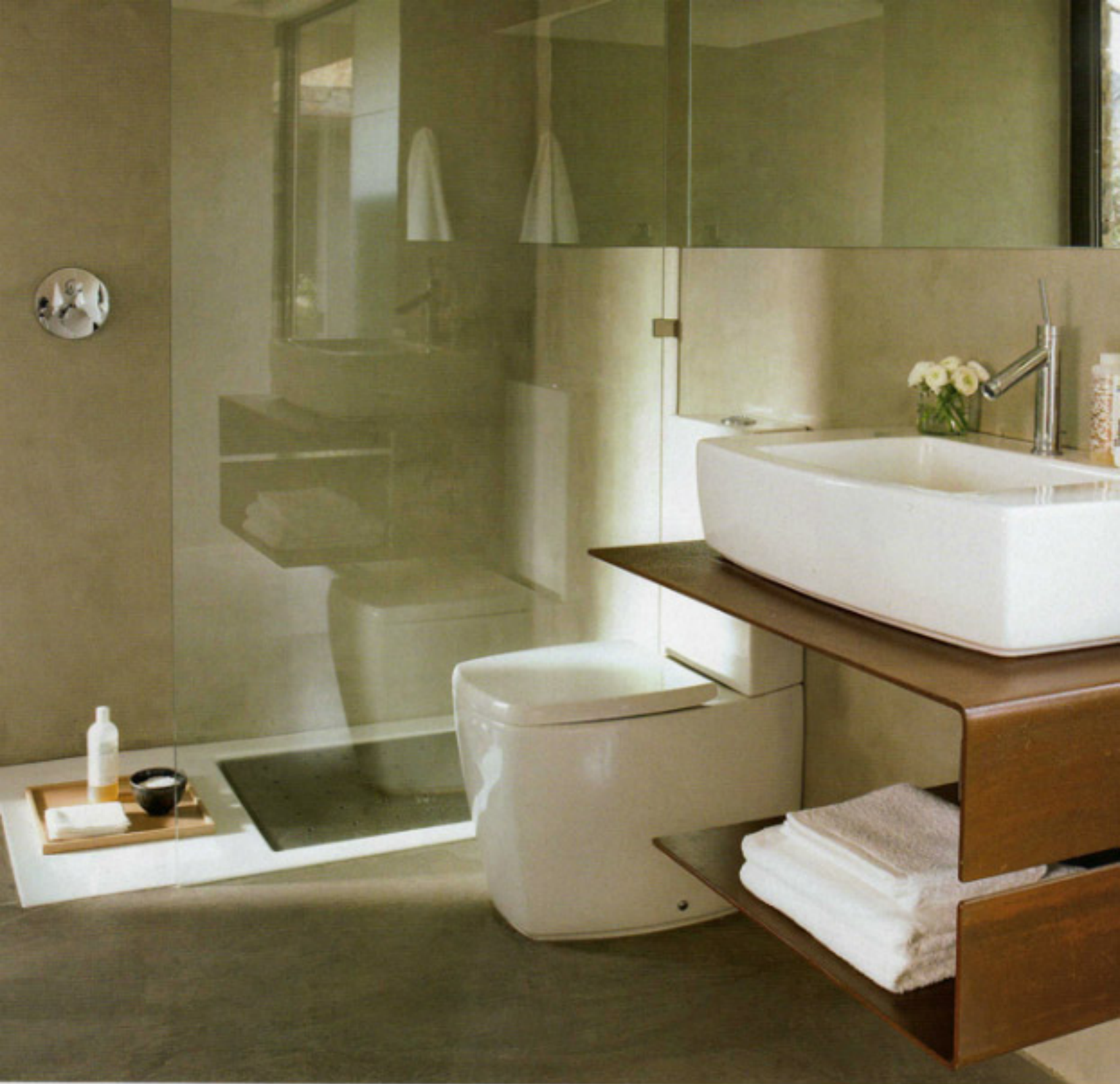
BAÑO. El suelo se ha pavimentado con resina cementosa de epoxi. Las paredes se han revestido con estuco a la cal con pan de plata. Lavamanos, plato de ducha e inodoro, de Galassia, en Joan Simó, Grifería Axor, de Hansgrohe.

de resguardar la privacidad puesto que la vivienda vecina se encuentra muy próxima. El acceso desde la calle se realiza a través de un breve espacio cubierto que protege de las lluvias y que esconde la puerta principal con una pared de piedra.