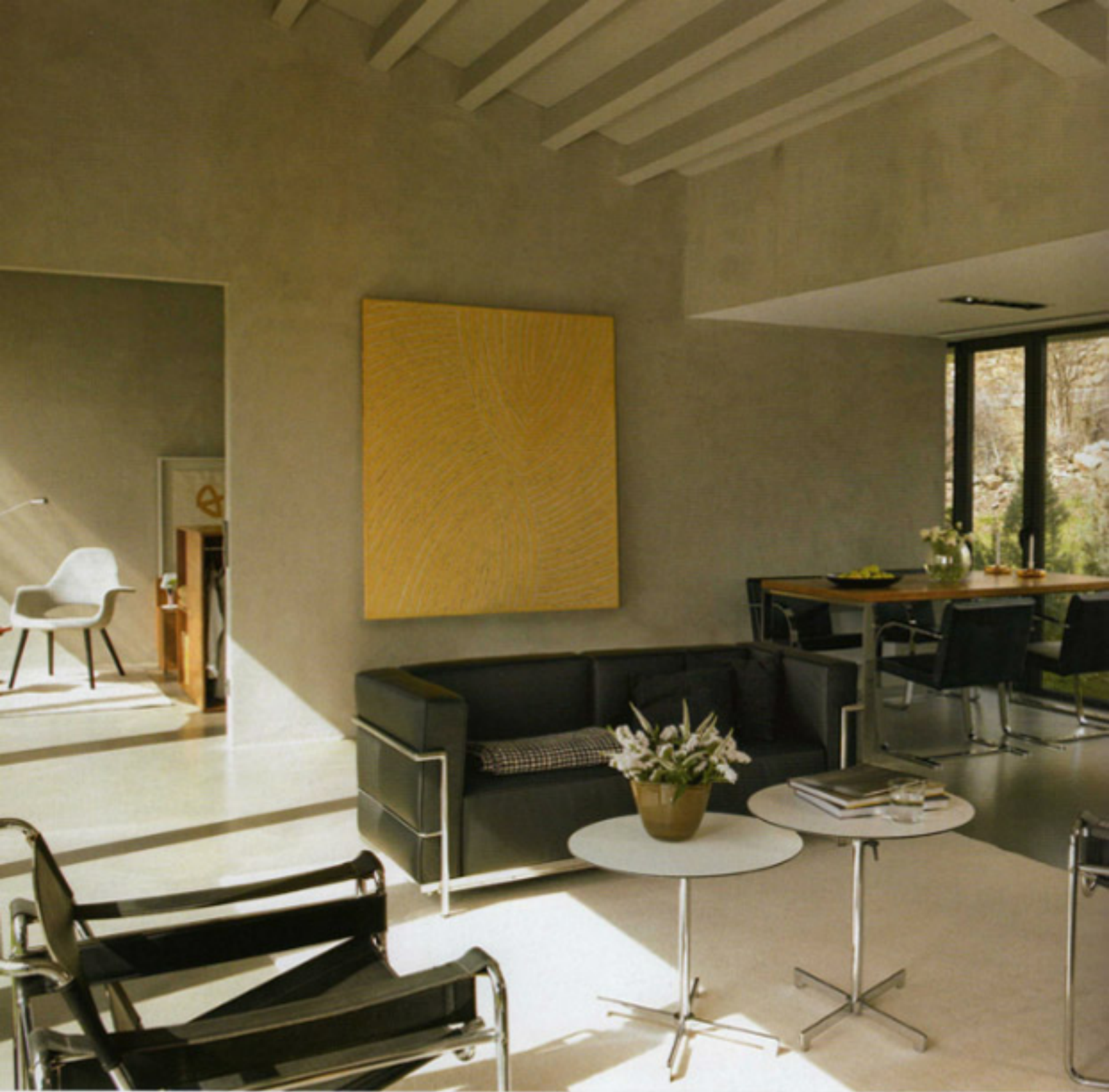
AMBIENTES COMUNICADOS. En el estar, mesitas Swiss, diseño de Mirto Zooca para è De Padova. Butacas Wassily, de Marcel Breuer, editadas por Knoll. Sobre el sofá, una obra de Manolo Ballesteros, en la galería Miquel Alzueta.

S e trata de una segunda residencia para un matrimonio con hijos, ubicada en una parcela de forma trapezoidal y con una leve pendiente, en el paisaje verde y montañoso del Ripollès, en Girona. El proyecto, firmado por el arquitecto Xavier Olivella, define –según el encargo de los clientes– una construcción de superficie muy reducida que consta solo de dos dormitorios.